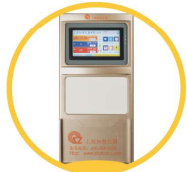
7寸真彩触摸屏 白板设计透明插页框